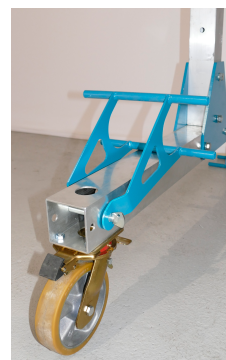
Ruote in Vulkollan 200 mm dotate di blocco della rotazione e freno

Dimensioni e regolazione stabilizzatori: